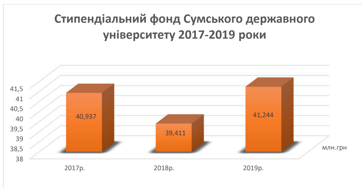
Рис. 2.2 – Стипендіальний фонд Сумського державного університету за період 2017 – 2019 роки.

На рисунку 2.2. можна побачити стипендіальний фонд Сумського державного університету за період 2017 -2019 роки.